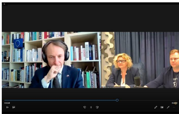
Głównym przedmiotem spotkania były nowe możliwości finansowe dla przedsiębiorców i samorządów lokalnych.