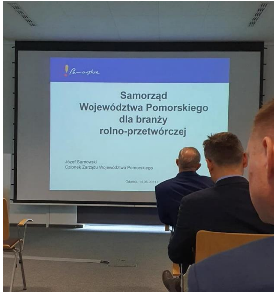
W spotkaniu wzięli udział najwięksi przedstawiciele branży w województwie pomorskim.

W poprzednich spotkaniach wzięli udział pracownicy Komisji Europejskiej zajmujący się funduszami strukturalnymi, eksperci z dziedziny prawa i pozyskiwania środków zewnętrznych. Każde spotkanie jest odpowiedzią na zapotrzebowanie zgłaszane zarówno przez współpracujące podmioty, ale także na coraz większe zainteresowanie tego typu spotkaniami.