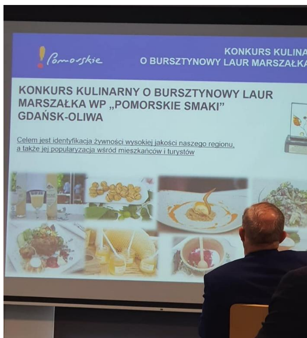
Przedstawiono także ofertę Samorządu Województwa Pomorskiego dla branży rolno-przetwórczej.