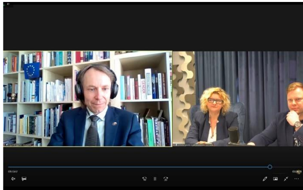
W spotkaniu wzięło udział ponad 70 osób!

W związku z dużym zainteresowaniem tego typu wydarzeniami, Pomorska Agencja Rozwoju Regionalnego S.A. będzie kontynuowała ten cykl wydarzeń. Zapraszamy do śledzenia naszego wydawnictwa i strony internetowej.