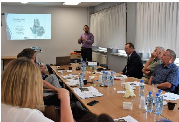
Podczas spotkania zaprezentowano ofertę i możliwości PARR w zakresie drukarek 3D.